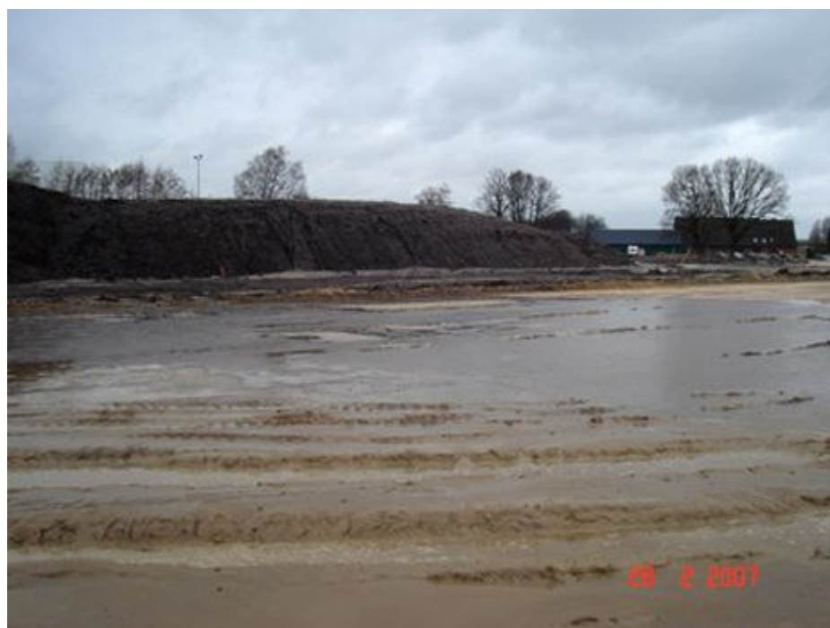
Der Baugrund vor Beginn der Maßnahmen

Die IBR-Flutlicht GmbH hat zwei Fußballfelder in Delmenhorst mit insgesamt acht Flutlichtmasten ausgestattet. Als besondere Herausforderung musste vor deren Errichtung zunächst das Grundwasser abgesenkt werden.