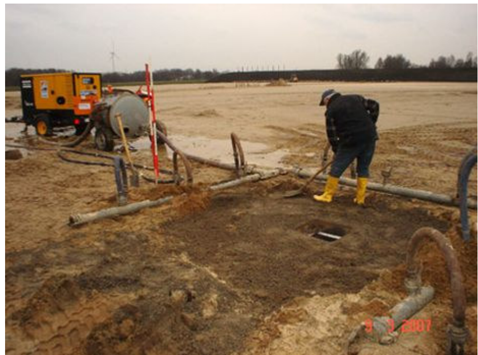
Das Fundament ist gegossen, es fehlt nur noch der Mast

Die acht Flutlichtmasten verfügen über insgesamt 22 Scheinwerfer des Modells SiCompact A2 Maxi von Sitceo, die mit einer Leistung von 2.000 Watt strahlen. Unter Vollast liefert die Anlage runf 46 Kilowatt pro Stunde. Die Masten wurden, abhängig von ihrer Lage am Sportplatz, mit jeweils zwei, drei oder vier Leuchten ausgestattet. Wichtig war es wegen der an der Anlage vorbeiführenden Autobahn, eine größtmögliche Blendfreiheit zu gewährleisten. (Stadionwelt, 28.03.07)