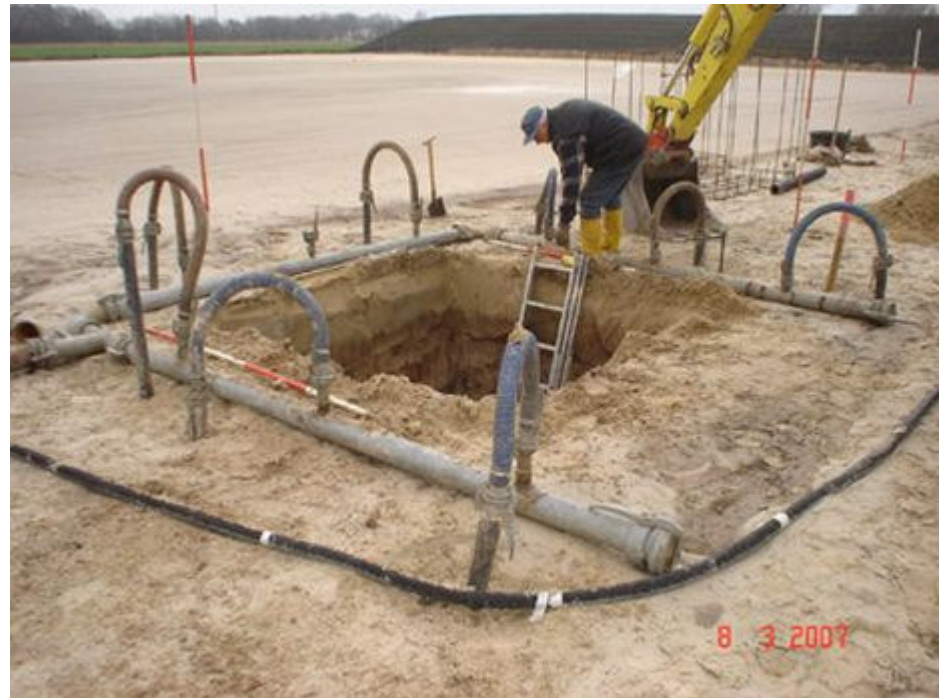
Der Aushub für das Fundament eines der Masten

Die acht Flutlichtmasten verfügen über insgesamt 22 Scheinwerfer des Modells SiCompact A2 Maxi von Sitceo, die mit einer Leistung von 2.000 Watt strahlen. Unter Vollast liefert die Anlage runf 46 Kilowatt pro Stunde. Die Masten wurden, abhängig von ihrer Lage am Sportplatz, mit jeweils zwei, drei oder vier Leuchten ausgestattet. Wichtig war es wegen der an der Anlage vorbeiführenden Autobahn, eine größtmögliche Blendfreiheit zu gewährleisten. (Stadionwelt, 28.03.07)