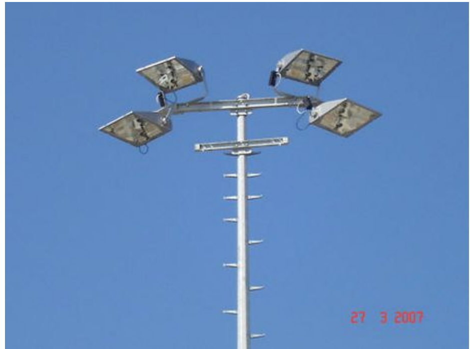
Die SiCompact A2 Maxi von Sitceo im Einsatz in Delmenhorst