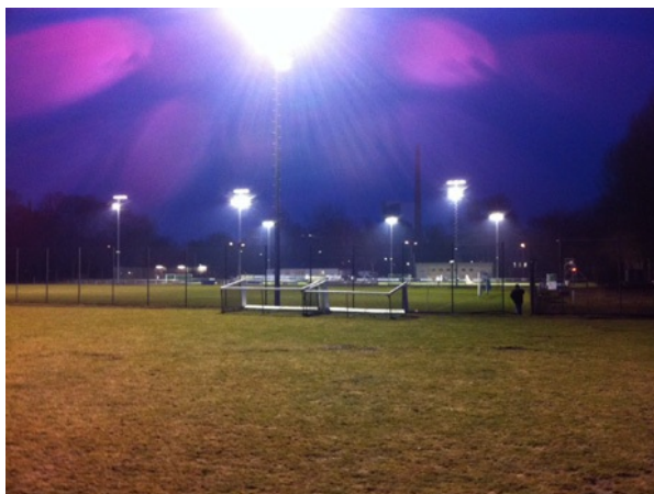
Für die Sportanlage Jahnplatz w urden neun Masten errichtet

Die Baukosten an den verschiedenen Sportanlagen im Stadtgebiet betragen rund 350.000 Euro. Laut Michael Loose, Abteilungsleiter der Stadt Braunschweig im Fachbereich Stadtgrün und Sport, w aren die Ersatzneubauten nötig geworden, da die alten Lichtanlagen nicht mehr den Sicherheitsbestimmungen entsprachen. Trotz des strengen Winters konnten die Baumaßnahmen, die im November begonnen w urden, bis Februar und März beendet werden. „Sie sind nun alle fertig und leuchten“, wie Michael Loose erklärte.